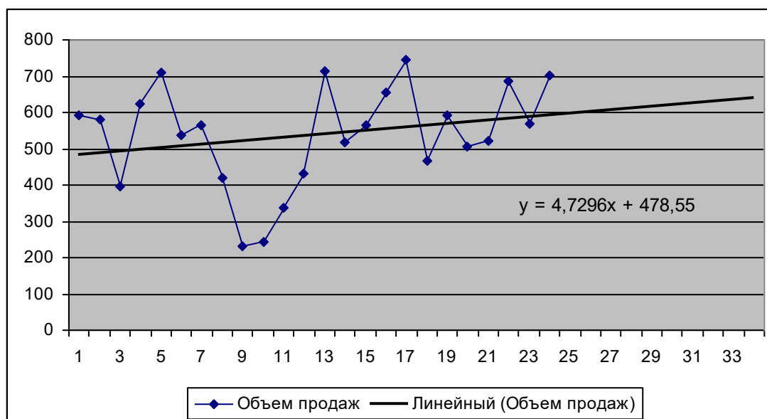
Рис. 5 Вид графика объема продаж